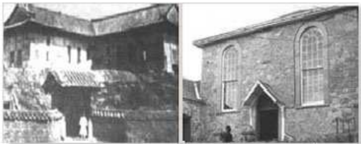
Changdaehyun Church in Pyongyang / Hanover Church in Walse